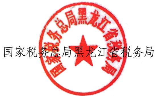
国家税务总局黑龙江省税务局