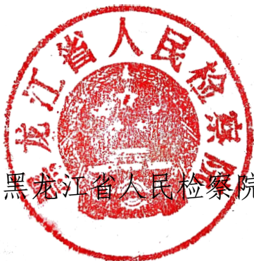
黑龙江省人民检察院

为依法推进我省企业合规改革试点工作，建立健全涉案企业合规第三方监督评估机制，有效惩治预防企业违法犯罪，服务保障我省经济社会高质量发展，黑龙江省人民检察院、黑龙江省司法厅、黑龙江省财政厅、黑龙江省生态环境厅、黑龙江省人民政府国有资产监督管理委员会、国家税务总局黑龙江省税务局、黑龙江省市场监督管理局、黑龙江省工商业联合会、中国国际贸易促进委员会黑龙江省委员会研究制定了《黑龙江省涉案企业合规第三方监督评估机制实施办法（试行）》《黑龙江省涉案企业合规第三方监督评估机制专业人员选任管理办法（试行）》，现印发你们，请结合实际认真贯彻落实。